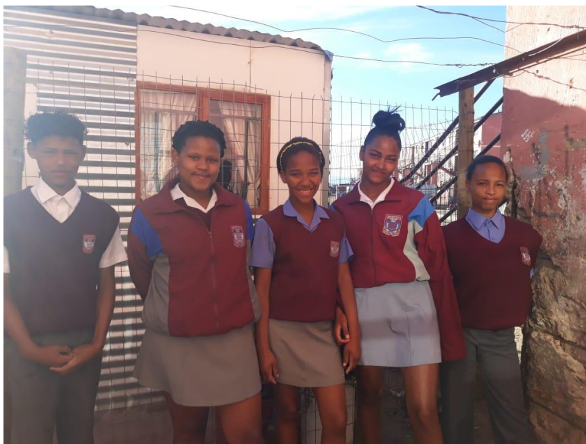
Schülerinnen unseres „Patenkinderprojektes“ in Worcester in Südafrika

Südafrika überweisen. Dafür werden Schuluniformen angeschafft. Herzlichen Dank nochmals an alle Spender!